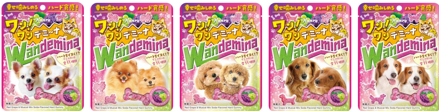
左から順にチワワ、ポメラニアン、トイプードル、ミニチュアダックスフンド、コーイケルホンディエ